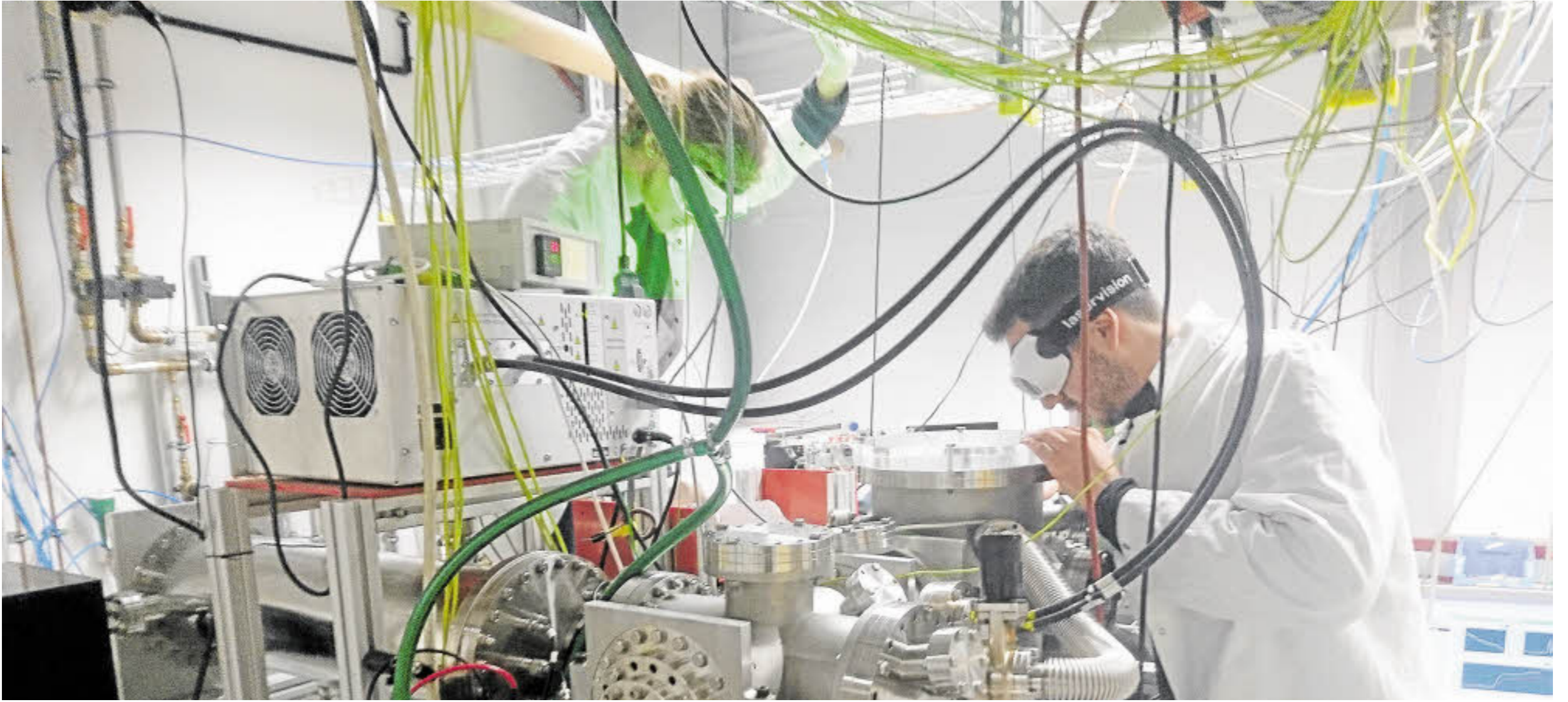
Hochvakuum und grüne Laserblitze zum Verdampfen von Metallen: Mithilfe dieser Versuchsanordnung untersuchen Forscher des Instituts für Optik und Atomare Physik an der Technischen Universität Berlin, was in Katalysatoren geschieht.