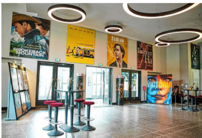
Das Filmtheater am Friedrichshain ist das letzte in Berlin, das seine Kinoplateaus noch von einem Künstler malen lässt.

Droste bewies, dass der Vertrauensvorschuss gerechtfertigt war. Sie spielte Hauptrollen wie in Brechts „Heilige Johanna der Schlachthöfe“, wechselte ans Deutsche Theater, wurde mit dem Faust-Theaterpreis ausgezeichnet. Parallel drehte sie mit Caroline Peters und Bjarne Mädel die ersten drei Staffeln „Mord mit Aussicht“. Als Polizeimeisterin Bärbel Schmied wurde sie zu einer Ikone. „Wir gucken die Serie immer wieder, auch mit den Kindern. Das Gesicht von Bärbel Schmied, wenn sie anfängt zu weinen – einfach herrlich“, sagt der Fan, jene Frau, mit der Droste ein Foto gemacht hat.